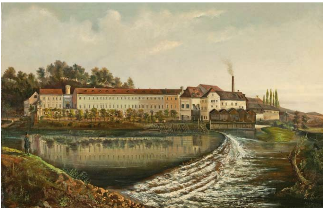
Ferdinand Lepié, Císařský mlýn, 1857, Muzeum hl. m. Prahy