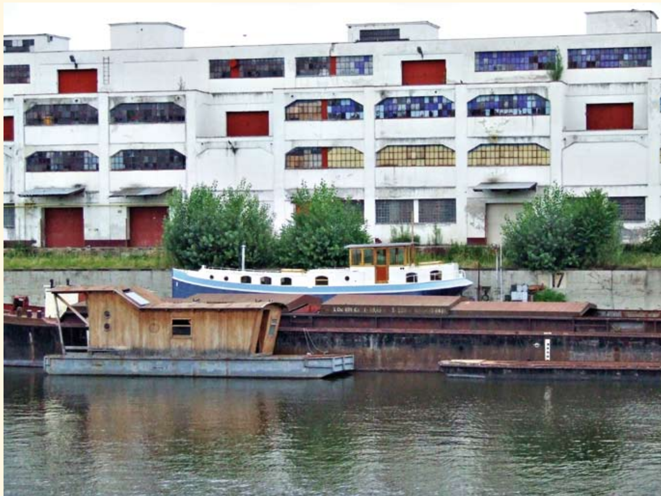
srpen 2010

Kaleidoskop syrového industriálu, krajiny spoutané dopravou a developerských vizí, to je Praha při dolním toku Vltavy mezi Helmovským jezem a Trojou