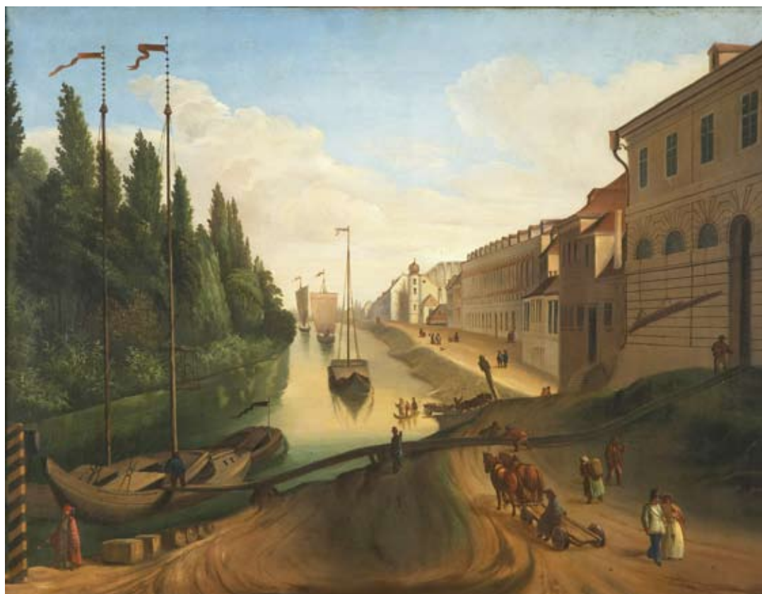
Anonym, Karlínský přístav, 1850, Muzeum hl. m. Prahy