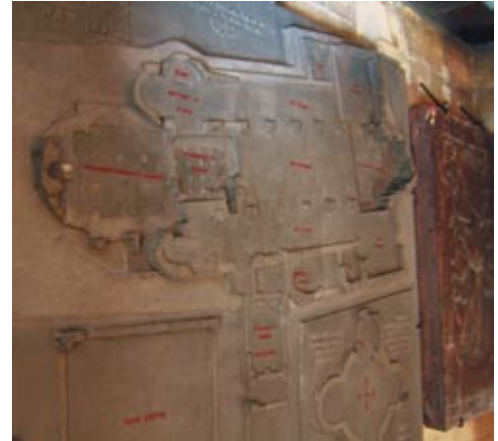
9. Torzální architektura pod katedrálou sv. Víta, Václava a Vojtěcha podle výzkumů Kamila Hilberta.