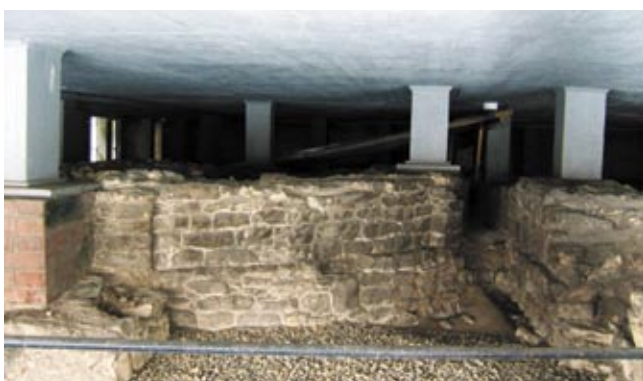
2. Kaple sv. Mořice a transept baziliky sv. Víta, Václava a Vojtěcha pod přístřeškem u Starého proboštství.