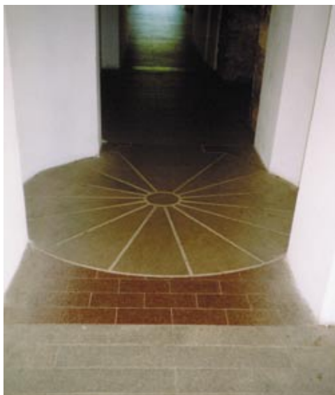
◀ 15. Stopa po vřetenovém schodišti v severním paláci s Rudolfovou galerií v západním průchodu Paccassiho brány.