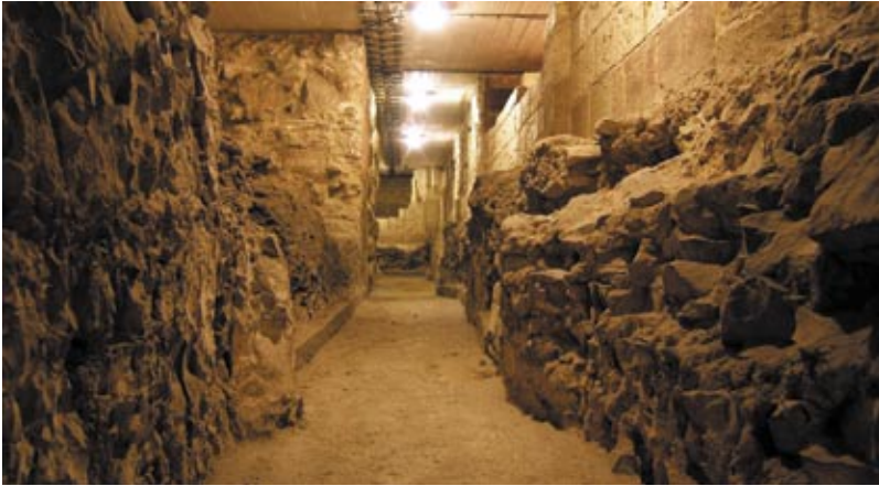
7. Základy a části nadzemního zdiva ambitu s křížovou chodbou kláštera Kostela pražského.