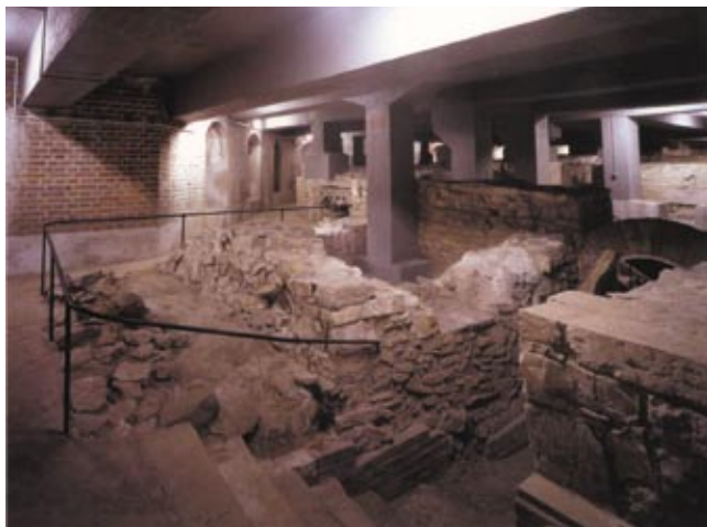
1. Základy a části nadzemního zdiva románských a gotických staveb, církevních i světských, pod III. nádvořím Hradu.