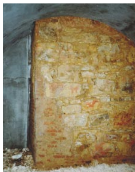
17. Pilíř Prašného mostu odhalený v průchodu valem dělicím Jelení příkop na západní a východní část.