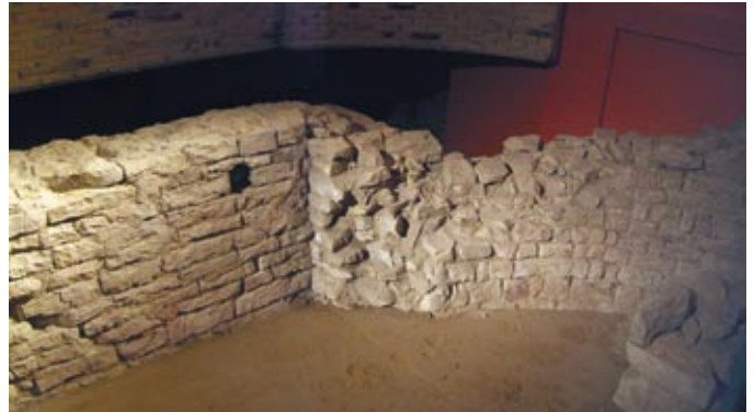
8. Podzemí chrámu sv. Víta, Václava a Vojtěcha. Biskupská hrobka ležící v místnosti vložené mezi severní zed' baziliky sv. Víta, Václava a Vojtěcha a ambit kláštera Kostela pražského.