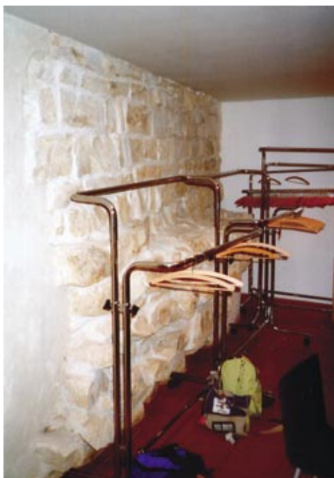
◀ 13. Šatny pod bývalou konírnou Rudolfa II. s torzem základového a nadzemního zdiva románské hradby Hradu.