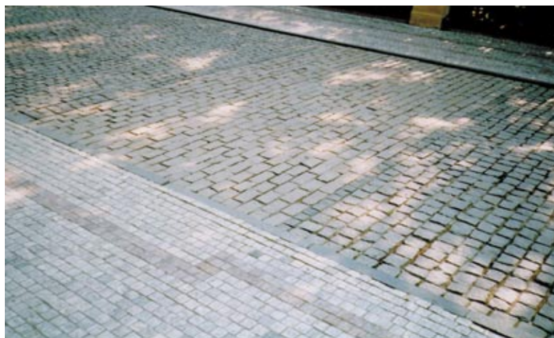
16. Pilíře Prašného mostu vyznačené v dlažbě.