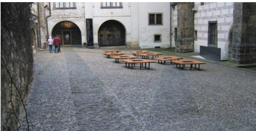
12. Průchod mezi II. a III. nádvořím Hradu s vyznačenou silou románské hradby.