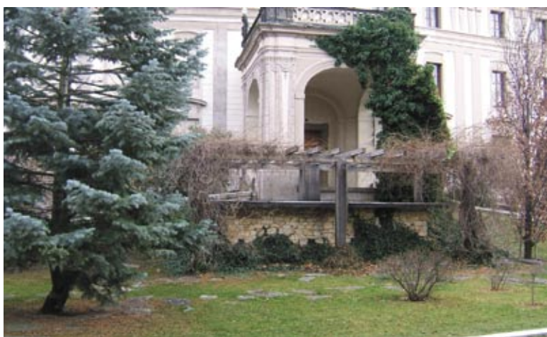
14. IV. nádvoří Hradu, zahrada Na baště. Zdivo středověké věže pod pergolou popínavých rostlin před vstupním portikem Španělského sálu.