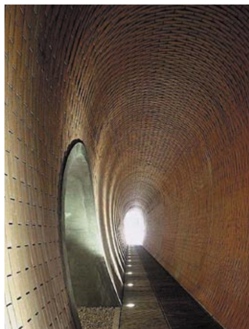
18. Průchod Jelením příkopem jakoby obalen konstrukcí z vrbového proutí. Obloukem v levé části se otevírá pohled na prezentovanou část pilíře Prašného mostu. Zdroj: AP atelier, Ing. arch. Josef Pleskot, realizace 04/2001–06/2002. ▶