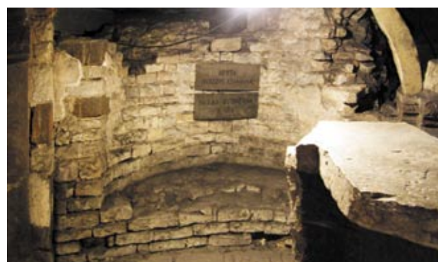
5. Východní apsida v kryptě sv. Kosmy a Damiána s torzem oltářní menzy.