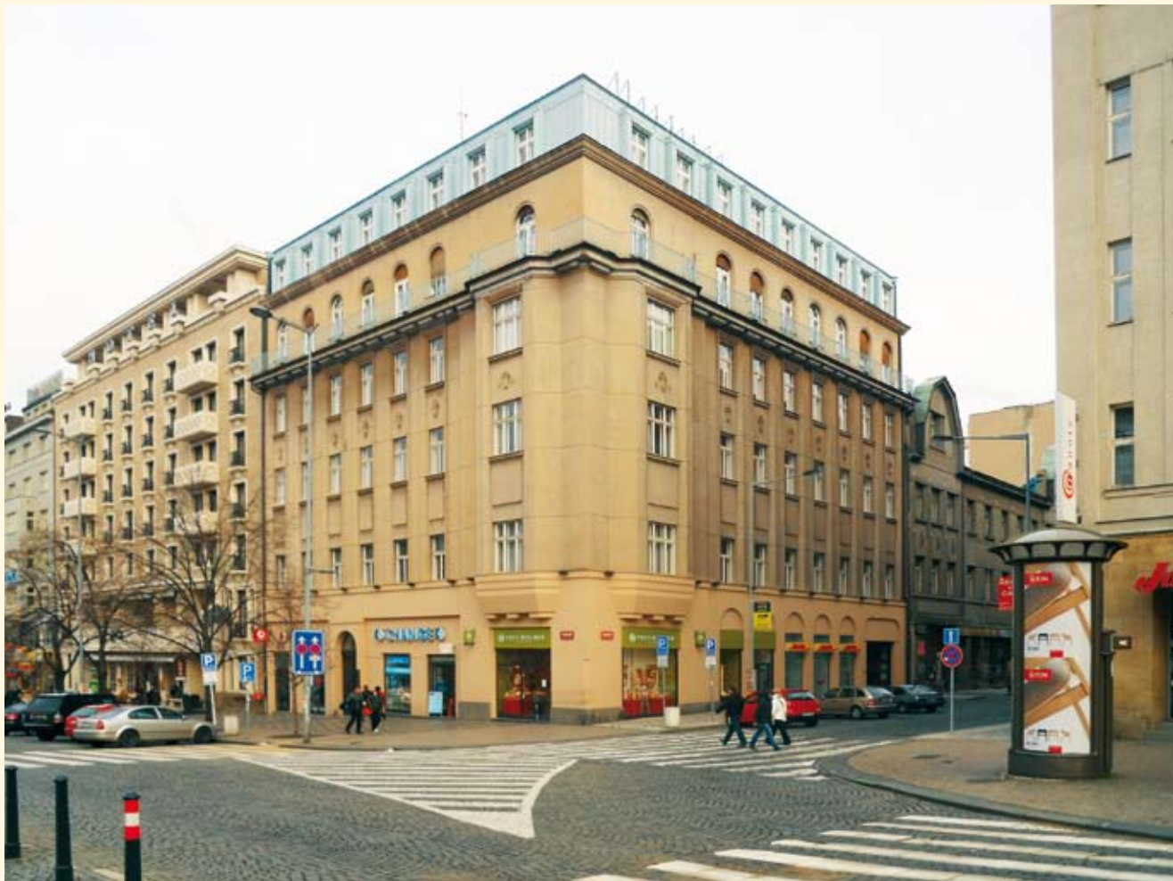
listopad 2010

„Co je moje, to je moje a to si můžu klidně zbourat!“ domnívá se majitel domu čp. 1601 na Václavském náměstí. Čtěte na s. 4.