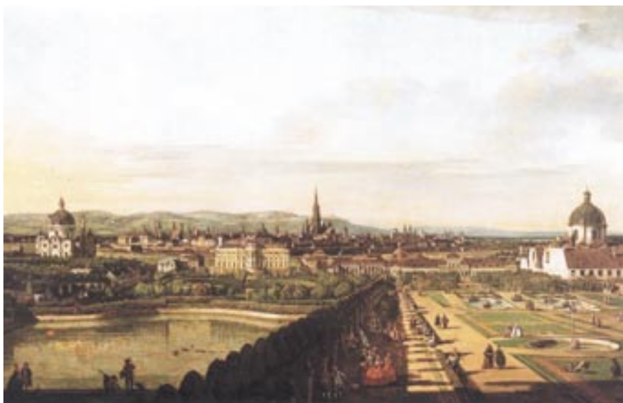
Slavný Canalettov pohled na Vídeň od Horního Belvederu z roku 1759 a zákres věžáků Wien-Mitte do srovnávacího pohledu ze současnosti.